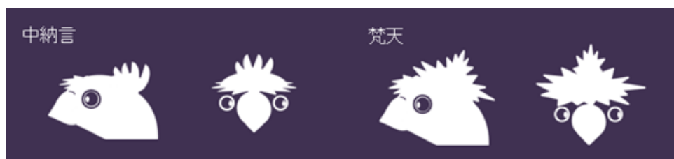
図3 「中納言」と「梵天」の違い

図3に本稿のそもそもの目的である「中納言」と「梵天」の違いについて示す。「中納言」は後頭部の毛が逆立っているジュウシマツである。「梵天」は頭の毛が巻き上がっているジュウシマツである。前からみると区別がつきにくい。